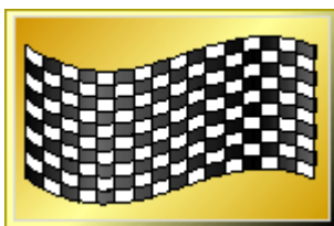
Svart/vit rutig flagga / Målflagga (chequered)

Denna flagga används normalt för att starta ett heat. Flaggan ska vid stående start, inte lyftas över huvudhöjd innan alla bilar står stilla på startplattan. Därefter höjs (start-)flaggan senast inom 10 sekunder. Skulle nationsflaggan av någon anledning inte användas, måste flaggans färg (ska aldrig kunna förväxlas med någon annan flagga som beskrivs i detta kapitel), vara specificerad i tilläggsreglerna för tävlingen.