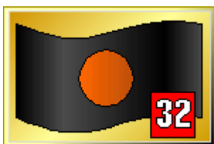
Svart med orange 40 cm runt fält/Tekniskflagga

Flaggan visas orörlig tillsammans med den tävlandes nummer. Används för att informera förare att dennes bil har ett mekaniskt problem som är en fara för såväl föraren som de medtävlande samt att denne måste stanna på sin bandepåplats före nästa varv. När problemet åtgärdats och besiktningschef eller biträdande gett klartecken får föraren fortsätta tränings- eller tävlingsheatet. Flaggan visas 2 varv tillsammans med tävlandes nummer.