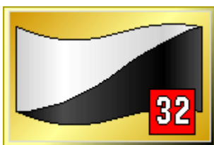
Svart och vit diagonaldelad flagga

Flaggan visas fast som en information att banbeläggningen är hal, förorsakad av regn eller oljespill o.dyl. Flaggan visas beroende på omständigheterna i minst 4 varv såvida banbeläggningen inte återgått till normal vidhäftning tidigare. Det är inte nödvändigt att visa grön flagga på den följande flaggposteringen.